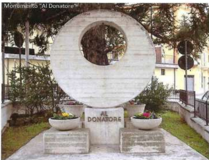
Monumento "Al Donatore"

Per aderire potete contattare i numeri sotto indicati o utilizzare la cartolina allegata.